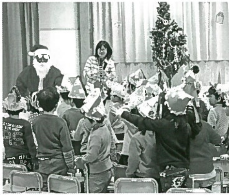
サンタクロース訪問の様子

八頭町の各保育所では毎年恒例行事としてクリスマス会にサンタクロースが訪問。子どもたちに夢と