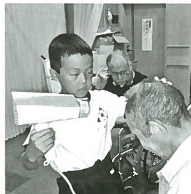
入浴後にドライヤー