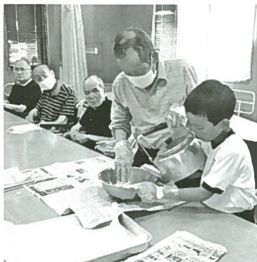
おやつ作りをお手伝い

社会福祉協議会では、福祉施設での体験活動とおして、多くの人と出会い、ふれあい、交流することにより、みんなが共に生きることや学び、福祉の芽を育むきっかけをつくるとともに、ボランティア活動への理解と関心を深めることを目的としています。この8月にも夏休みを利用して小学生が一人でデイサービスのボランティアに参加しました。最初は、初めてという事で何をやるんだろうと不安な顔をしていましたが、回数を重ねるとに笑顔が増え、利用者の皆さんも大変喜んでいました。最後の日には笑顔で『楽しかった、また来たいです』と言って帰っていきました。ちよつとした時間だったかもしれませんが、ボランティア活動を通して楽しさや思いやりの心が育むことができたと思います。