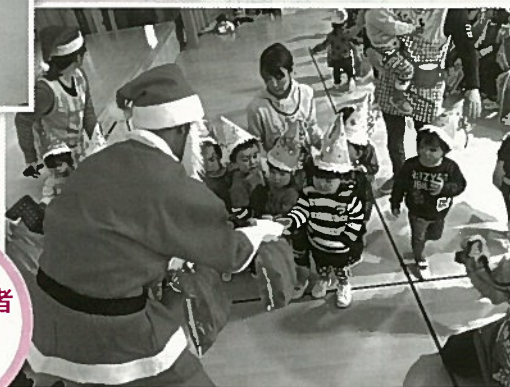
保育園児クリスマスプレゼント 事業、小学生福祉体験、 保育所、小・中学校生産活動