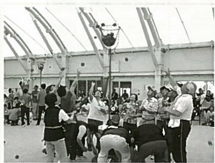
老人クラブスポーツ大会助成、 独居高齢者の集い、長寿お祝い事業他