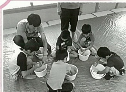
*写真は、29年度の活動の様子です。