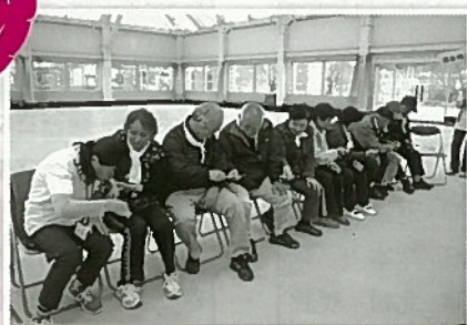
作業所助成、障がい者交流事業、 身障スポーツ大会助成他