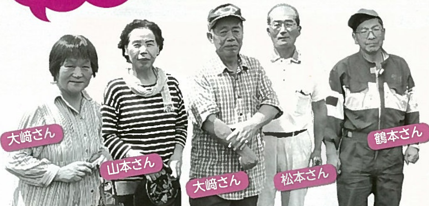
菜園倶楽部のみなさん