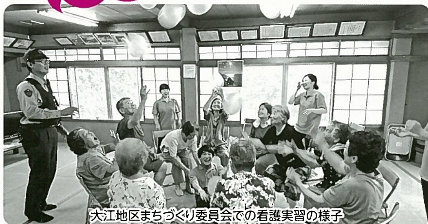
大江地区まちづくり委員会での看護実習の様子

八頭町社協 ホームページで 「生活支援 コーディネーター ブログ」 を続々更新中!