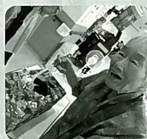
本所デイサービス

破れない網を使つての金魚すくい(おも ちゃの金魚)やお玉でおやつのかみ取り を行い、「ご利用者様の嬉しそうな表情がた くさん見られました。職員が傘踊りを披露 して皆さんが大変喜ばれ、一緒に楽しい時 間を過ごしました。」