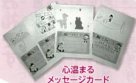
心温まる メッセージカード

保護者と協働し、子 どもたちのメッセージ カードを地域の高齢者へ お届けする敬老訪問を行 い、世代間での豊かな心の 交流を深めておられます。こ の度は受賞おめでとうござい ました。