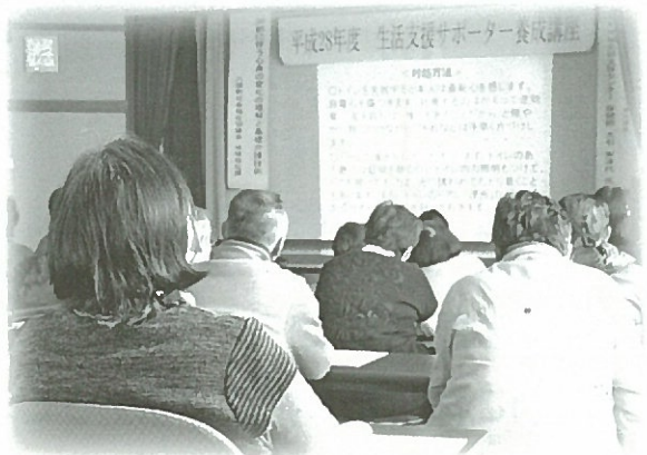
当日の会場の様子

本講座の修了者は個人としての日常的な活動の他、登録者の皆さんで傾聴ボランティアグループとして活動されるなど、活動は広がりを見せています。地域での支え合いが見直されている中、生活支援サポーターの今後のますますの活躍が期待されています。