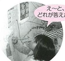
え〜と、 どれが答えかな