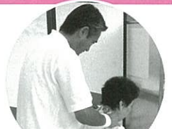
↑無料体験マッサージでリラクゼーション