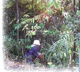
雨の降る中の作業、ありがとうございました。

11月17日、八東地域有志のボランティアと職員による、かじや温泉周辺の雑木伐採作業を行いました。温泉からの景観保持が目的で、伐採後はとても見晴らしが良くなりました。