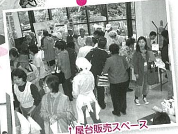
↑屋台販売スペース