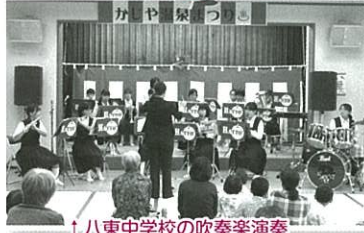
↑八東中学校の吹奏楽演奏