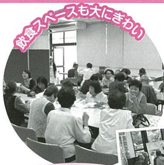
飲食スペースも大にきわりの

外はあいにく冷たい雨が降り続けていたものの、会場内は最後の大抽選会まで一日中熱気であふれていました。