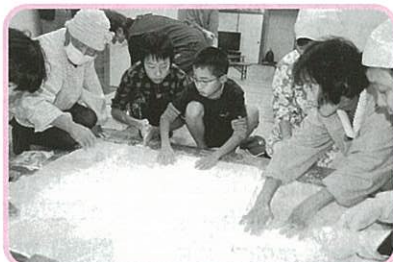
子どもらも手伝って丸めました