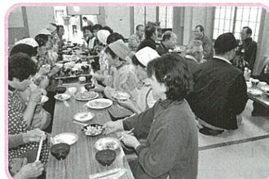
餅をおいしくいただくサロン参加の皆さん