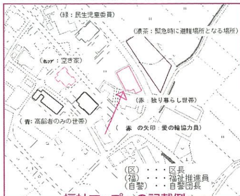
福祉マップへの記載例