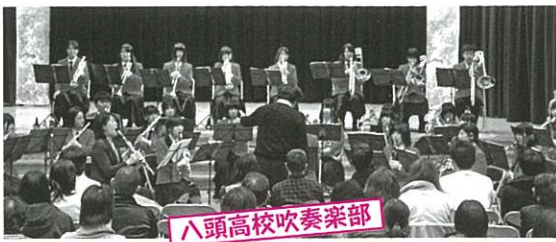
八頭高校吹奏楽部