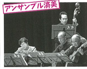
アンサンブル済美