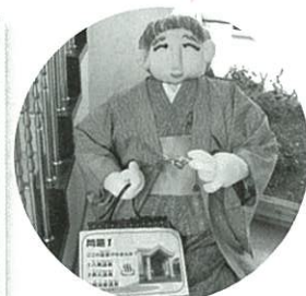
↑かかしのお出迎え