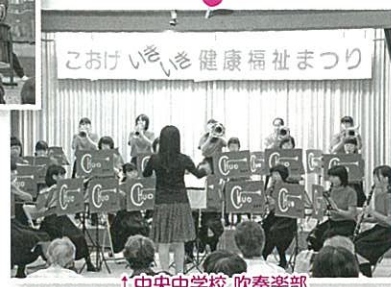
↑中央中学校 吹奏楽部