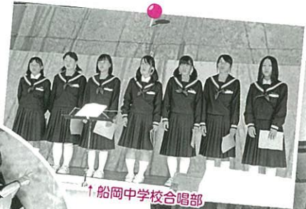
↑船岡中学校合唱部