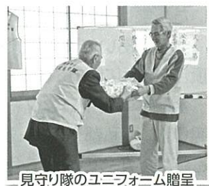
見守り隊のユニフォーム贈呈

をかけやすいと、地域のつながりづくりが早速効果があがっています。また、警察の担当課からも活動への期待を込めて交通安全旗を贈与頂きました。当初30名で始めたこの取り組みですが「取り組みを聞いた、協力したい」と賛同者が日を追うごとに増え、発足の時には50名以上にまでなりました。集落外からも関心が高く、この活動が更なる広がりを見せていくことが期待されます。