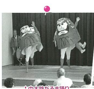
↑中大路だるま踊り