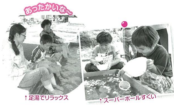
↑足湯でリラックス

また、中庭の芝生広場では各種屋台が並び、気軽に温泉体験ができる「足湯」も設置。子どもからお年寄りまで、地域住民の交流の場として楽しい時間を過ごしていただけたようです。