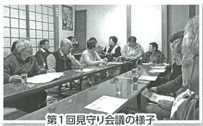
第1回見守り会議の様子

また、2か月に1回は定例の「見守り会議」を実施し、情報の共有を行うようにしています。そこには必要に応じ、関係機関の招集も予定しており、地域・関係機関が一体となって考えて取り組むことができる場として大きな可能性を秘めています。