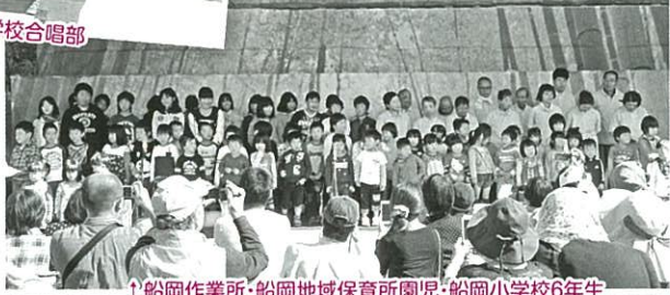
↑船岡作業所・船岡地域保育所園児・船岡小学校6年生