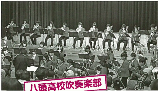
八頭高校吹奏楽部