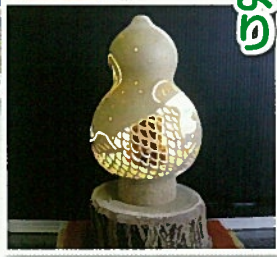
手作りの→ ひょうたんランプ