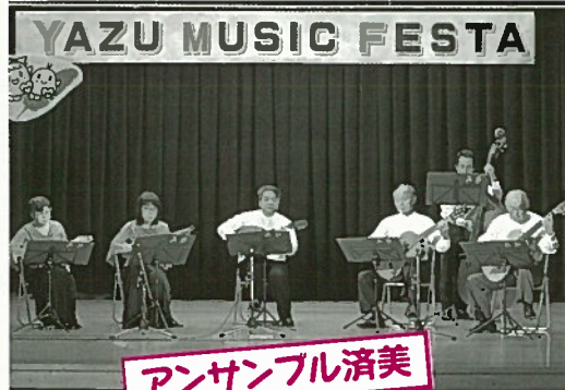
アンサンブル 済美