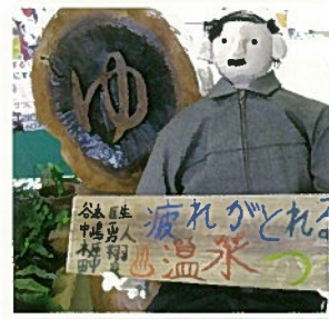
↑ 手作りのかかしが 八東地域福祉センター でお出向かえ