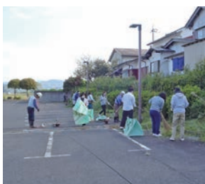
シルバー人材センター 清掃活動の様子