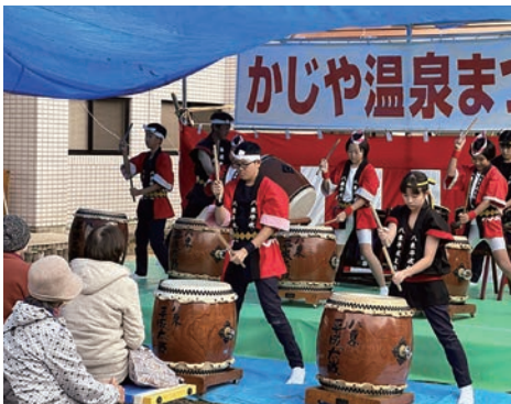
力づよい演技「八東平成太鼓」

まつりの最後には、八東小唄を輪になり踊り、会場が1つになり地域の力が溢れる賑やかなまつりとなりました。