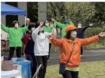
みんなで♪八東小唄♪♪