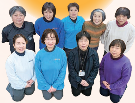
八頭町社会福祉協議会 訪問介護事業所 ☎0858-73-0672

利用者様はもちろん、 ご家族の負担を 少しでも軽くするため 全力でサポートさせて いただきます。 ご相談ください。