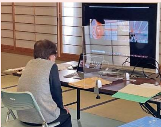
写真は通所型介護予防教室のリモート指導

現在の社会情勢による自粛生活の長期化や活動の制限等が続く中、本会ではICTを活用したリモートによる福祉活動を進めております。対面による交流の素晴らしさは言うまでもありませんが、何もしままで人と人とのつながりが薄れてしまつ一方です。現在では地域福祉活動関連(まちづくり委員会などの会議や介護予防教室の訓練指導など、可能なことから進めております。