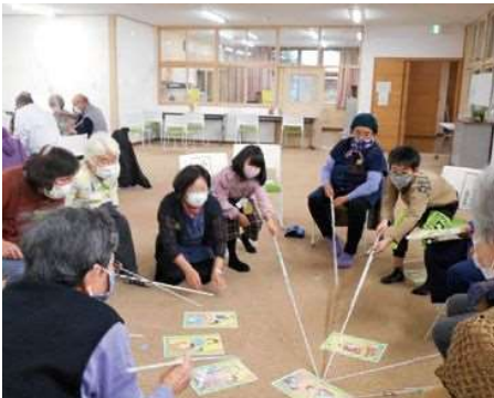
国や県のガイドライン、町の助言を参考に感染対策を取りながら、交流を深めました。

当日は20名の児童と、50名程度の船岡地区の皆さんが船岡地区福祉施設に集まり、感染対策を取りながら、順番に牛乳パックを積み上げるゲームやカルタとりで交流を深めました。交流授業に参加した児童からは、「高齢者の方は、動きがゆっくりなのかなと思っていましたが、ぼくたちよりも早くて、カルタとりが強かった」「こわいのかなと思っていましたが、笑顔でやさしく接してくれてうれしかった。自分も笑顔で接してあげたいと思った」といった感想が寄せられ、支え手としての意識を育んだだけではなく、高齢者に対して改めて「すごいな」という尊敬のまなざし