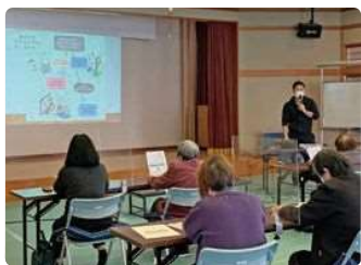
健康・介護の講座