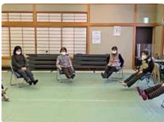
輪になって頭の体操