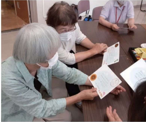
メッセージには 「体に気をつけて、がんばってください」

「あったかいことばでつながろうプロジェクト」は、対面接触が制限される今の社会情勢にあっても、つながりを確かめ、深め、あるいは新たにつくり、広げていくために、レベルアップしながら取り組みを進めています。