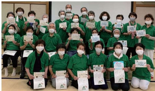
たくさんのメッセージに“笑顔満開”

また、メッセージカードを受け取られた地域の皆さんからは、昨年東京で開催された大イベントになぞらえ「水泳をがんばっている