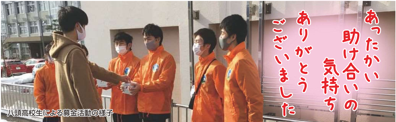
八頭高校生による募金活動の様子