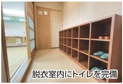
更衣室内にトイレを完備