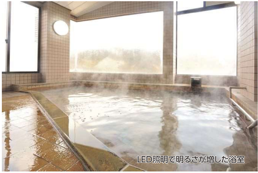
LED照明で明るさが増した浴室

大変お待たせしました。施設増設工事のため休館をしておりました「鍛冶屋温泉」がリニューアルオープン致しました。