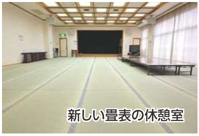
新しい畳表の休憩室