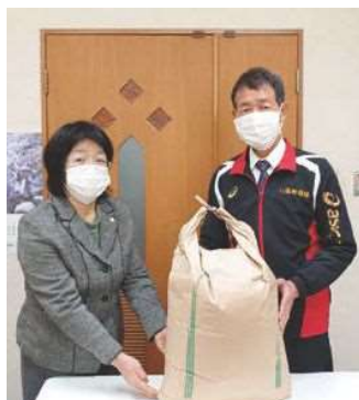
JA 鳥取いなば女性会 郡家支部様より

JA 鳥取いなば女性会郡家支部 米 25 kg JA 鳥取いなば女性会船岡支部 米 10 kg JA 鳥取いなば女性会八東支部 米 30 kg