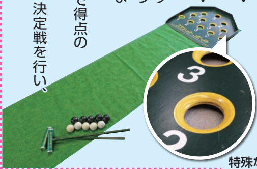
特殊なカーブがついている得点穴

この他にも様々なレクリエーション用品がありますので、詳しくは本所・各支所にお問い合わせください。