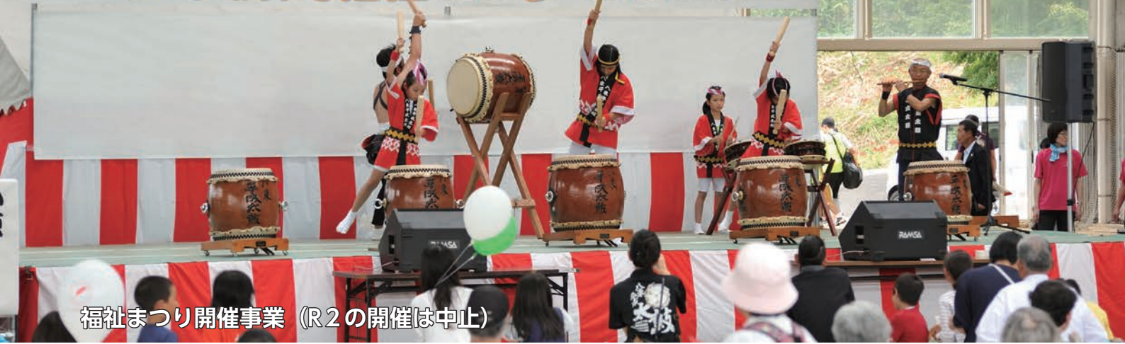
福祉まつり開催事業 (R2の開催は中止)