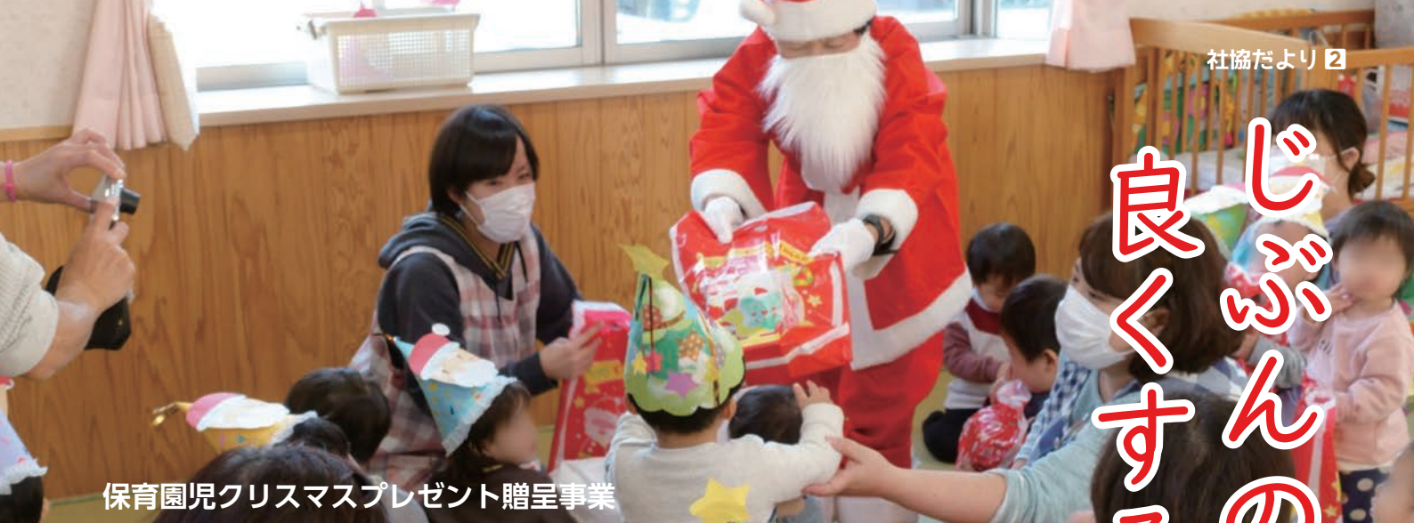
保育園児クリスマスプレゼント贈呈事業