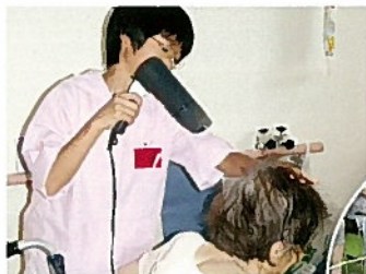
デイサービスでの福祉活動体験

小中高校生に、福祉施設や福祉サービスを体験学習の場として提供したり、利用者との交流を深めています。