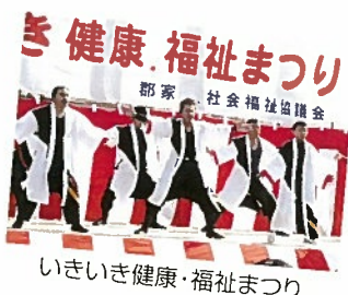
いきいき健康・福祉まつり