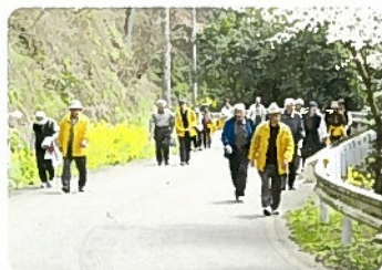
ウォークリー（歩こう会）