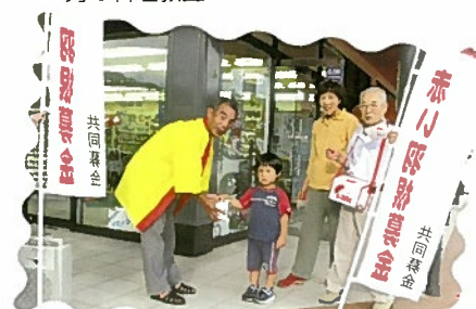
赤い羽根共同募金