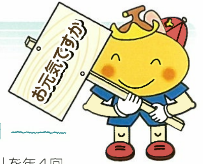
八頭町社協 イメージキャラクター 「やすちゃん」