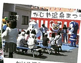
かじや温泉まつり