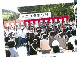
メニューダまつり