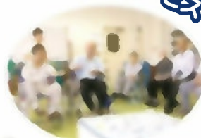
レクリエーション(ゲーム)