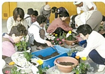
ガーデニング教室