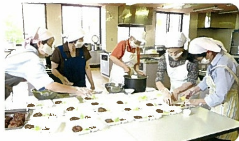
食事サービス(調理)

ボランティアの皆さんに調理と配食をお願いし、ひとり暮らしの高齢者や老夫婦世帯に食事サービスを行っています。会食会も行い、利用者どうしの交流も図っています。